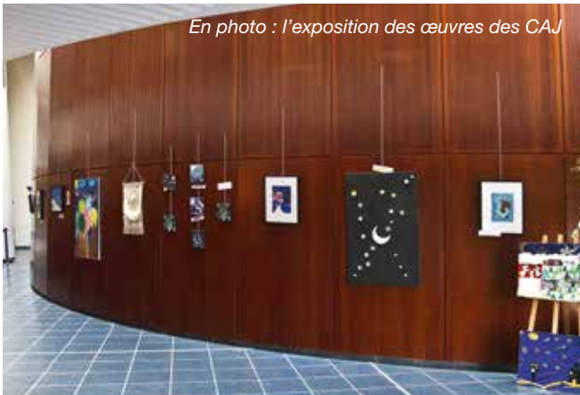
En photo : l'exposition des œuvres des CAJ

Un partenariat solide avec le conservatoire à rayonnement régional Marcel Dadi à Créteil.