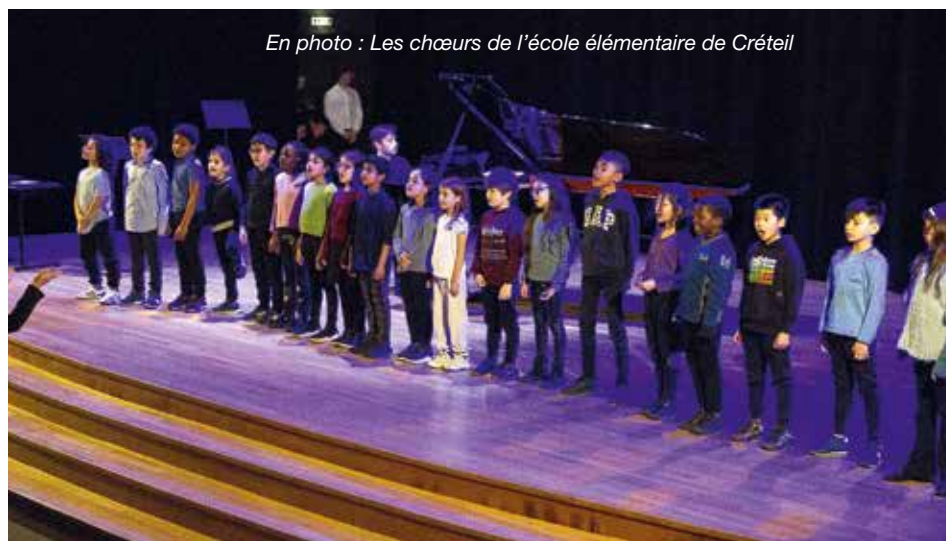
En photo : Les chœurs de l'école élémentaire de Créteil