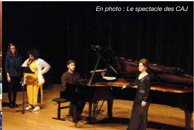
En photo : Le spectacle des CAJ