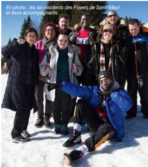
En photo : les six résidents des Foyers de Saint-Maur et leurs accompagnants.

Le transfert à la montagne de six résidents, à Passy en Haute Savoie, dans le village-vacances de Guébriant, du 11 au 18 février 2023.