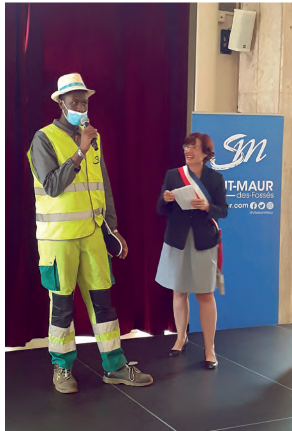
Remise du chapeau de jardinier