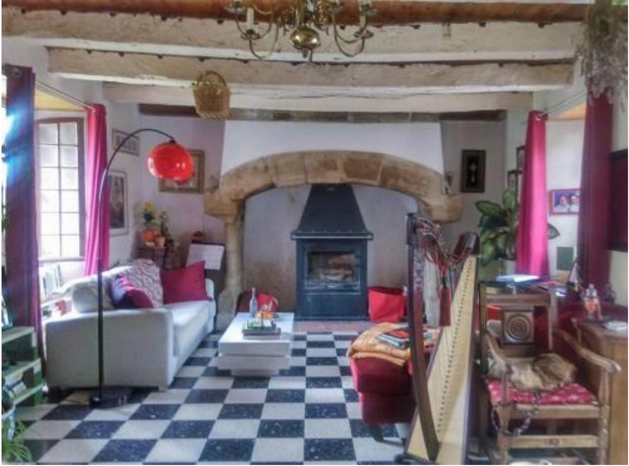
Le Salon commun principal, dans notre maison :