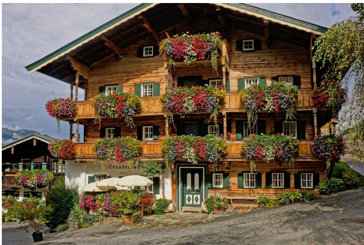
Maison tyrolienne typique.

Nombre de personnes accueillies : 1 à 2 personnes.